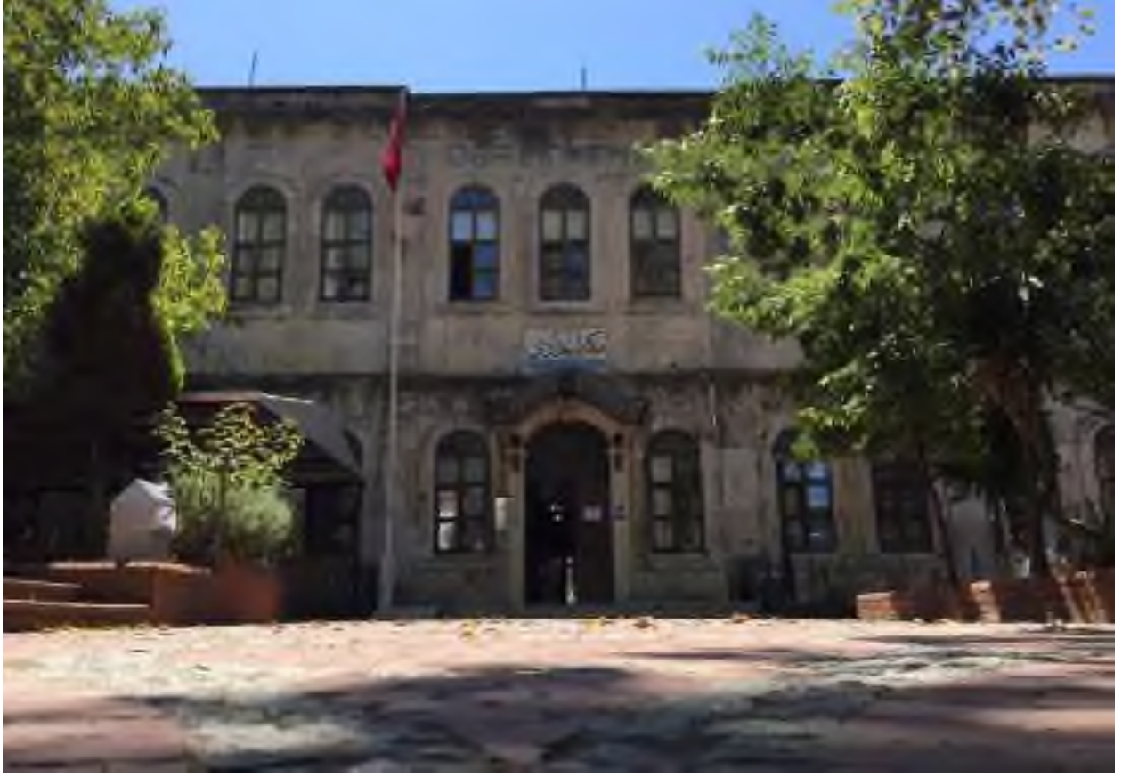
Kemalettin Sami Paşa'nın ilk gittiği okul "Mekteb-i İdadi (Sinop)

portajları ile destek veren değerli kişiler sırasıyla;