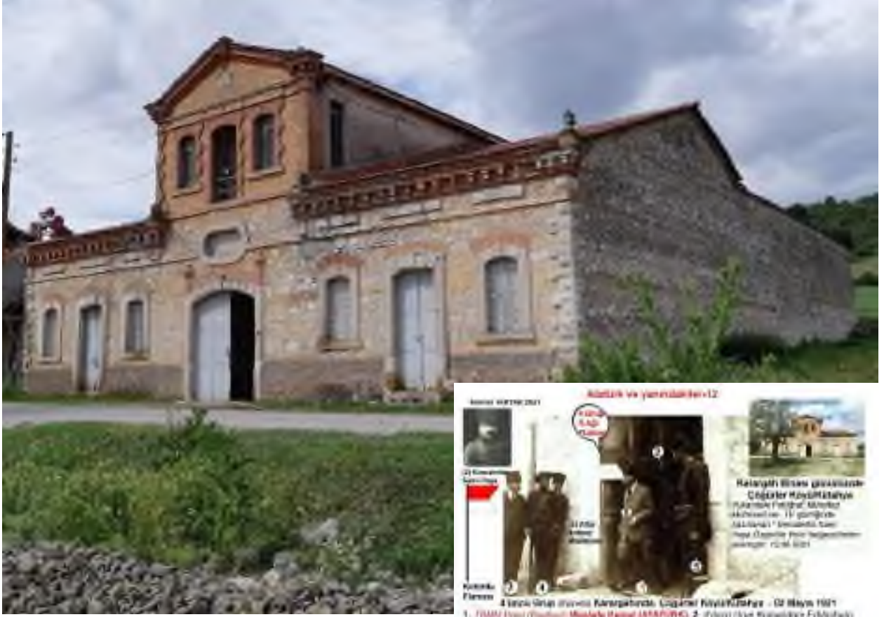
4. Grup karargah binası Çöğürler / Kütahya

- 10 Aralık 1920 - 4 Mayıs 1921 1. Tümen ve Ankara Komutanlığı