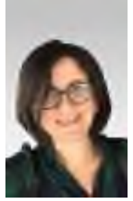
DİLEK İLHAN Line TV

Balkan Savaşı'nda sağ kolu sakatlanan, Çanakkale'de kolundan tekrar yara alan, 1. ve 2. İnönü'de, Kütahya-Eskişehir'de, Sakarya'da, Büyük Taarruz'da vücudunda kurşun ya da şarapnel değmemiş tek nokta kalmayan, I. Dünya Savaşı'nda birçok cephede çarpışan,