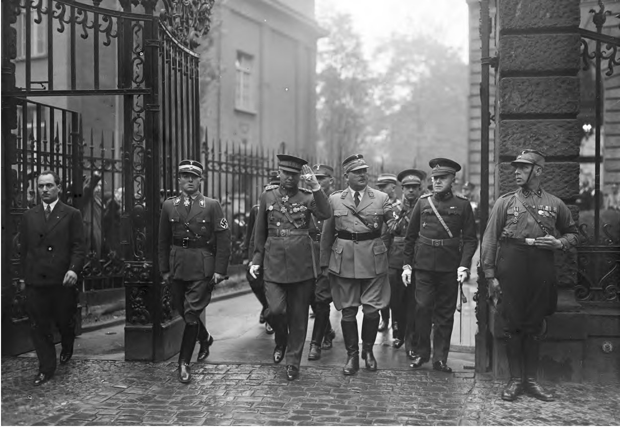
Türkiye'nin Cumhuriyeti'nin 10. kuruluş yıldönümü kutlamaları Kemalettin Sami Paşa, SA Genelkurmay Başkanı Ernst Röhm, Türk Askeri Ateşesi ve SA grup lideri Karl Ernst