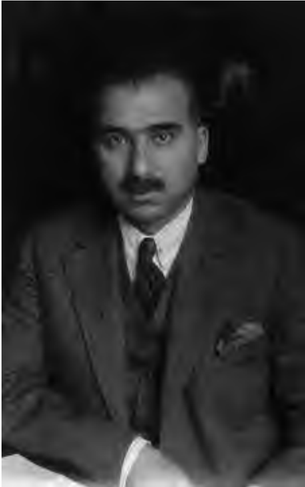
Kemalettin Sami Paşa - 1923