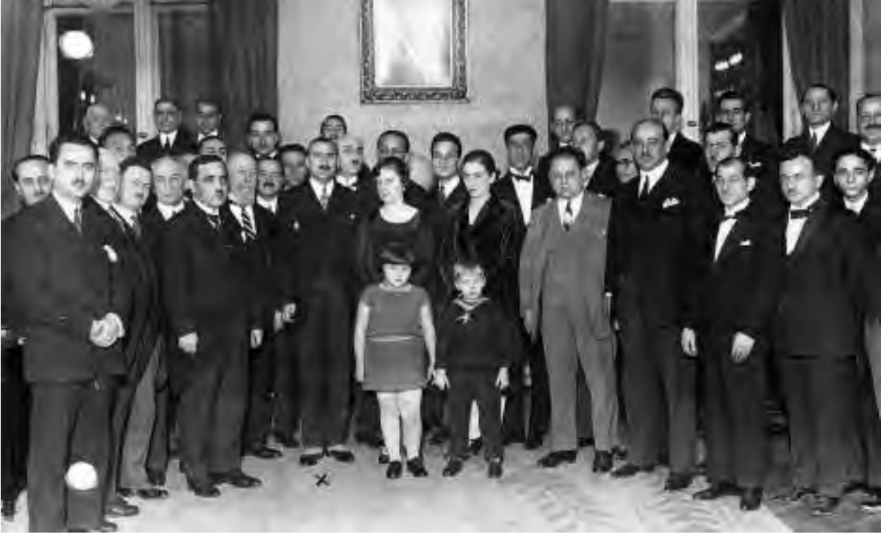
Türkiye Cumhuriyeti'nin resmi ilanının yıldönümü olan 29 Ekim'de Berlin'deki Türk Büyükelçisi Kemalettin Sami Paşa ve yanındaki eşi, Berlin Türk kolonisini karşılıyor.