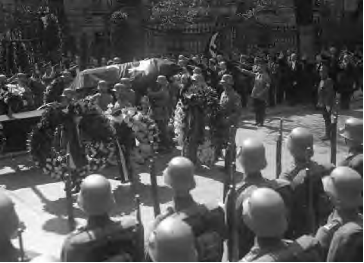
Türkiye'nin Berlin Büyükelçisi Albay General Kemalettin Sami Paşa'nın resmi devlet cenazesi. Tabutun arkasında Reich Genelkurmay Başkanı Röhm ve Başbakan Yardımcısı v. Papen.