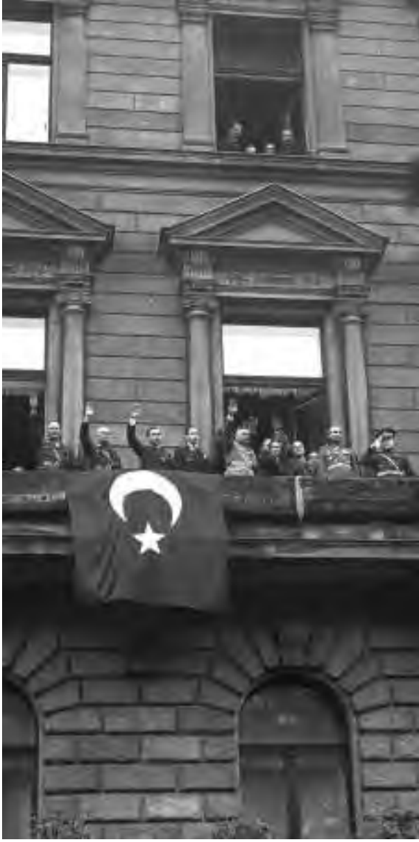
Berlin'deki Türk Büyükelçiliği Balkonu Ekim 1933